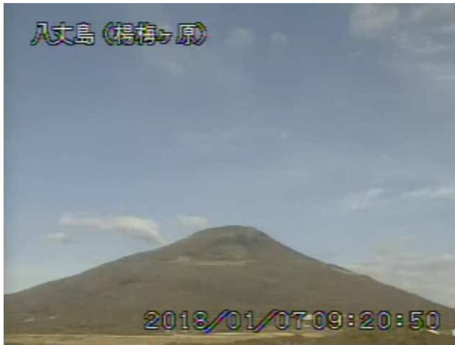
図 1 八丈島 西山山頂部の状況 (1月7日、楊梅ヶ原 ようめがはら 監視カメラによる)

1) GNSS (Global Navigation Satellite Systems) とは、GPSをはじめとする衛星測位システム全般を示す呼称です。