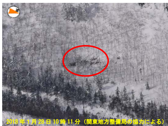
図4 草津白根山 23日に噴火が発生した西側の火口