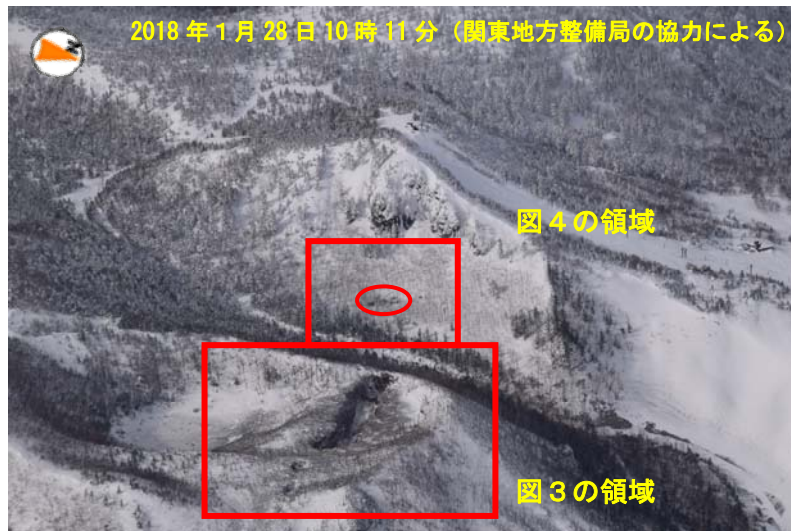
図2 草津白根山 鏡池北側の火口の状況