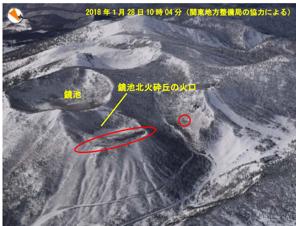
図1 草津白根山 本白根山鏡池北付近の状況