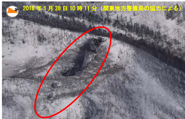
図3 草津白根山 23日に噴火が発生した火口