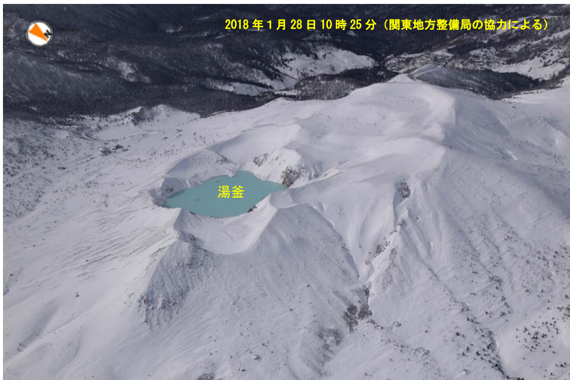
図6 草津白根山 湯釜火口及び水釜火口周辺の状況