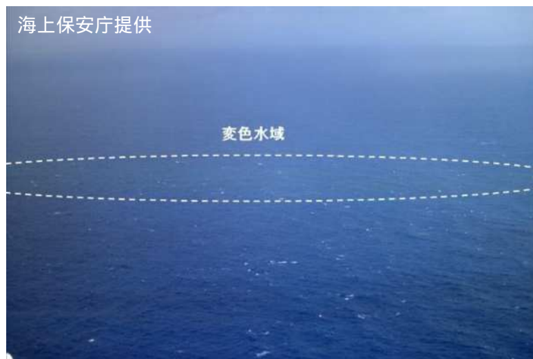
図 1 福徳岡ノ場 変色水域（2017 年 12 月 11 日撮影）

福徳岡ノ場では、しばしば変色水や浮遊物が観測されており、2010 年 2 月 3 日には小規模な海底噴火が発生しています。