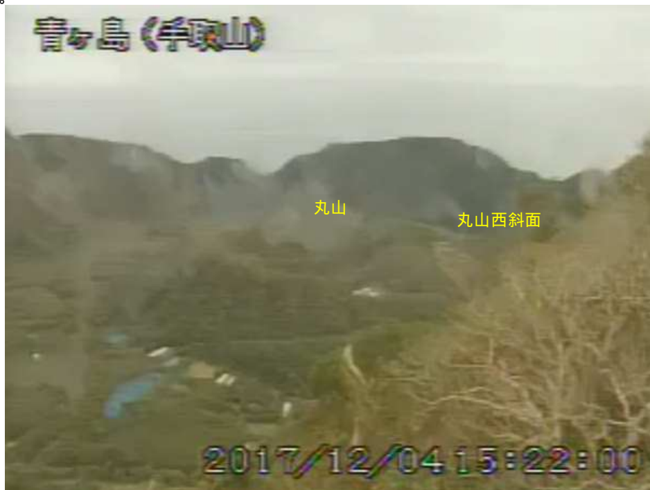
図 1 青ヶ島 丸山西斜面の状況（12 月 4 日 手取山監視カメラによる）

1) GNSS (Global Navigation Satellite Systems) とは、GPS をはじめとする衛星測位システム全般を示す呼称です。