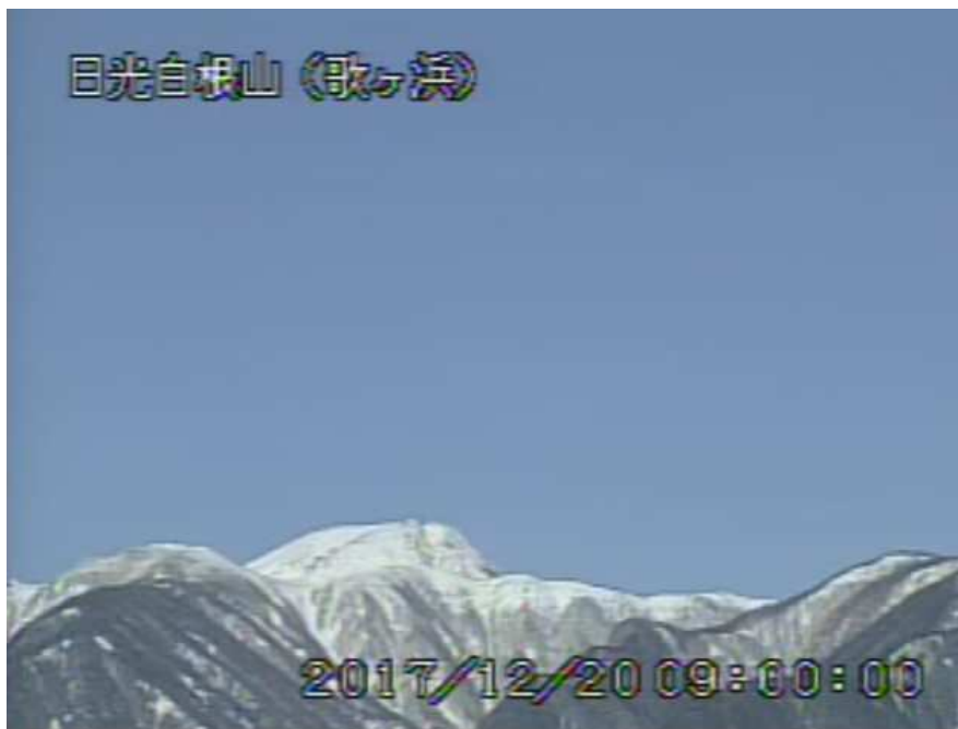
図 1 日光白根山 山頂部の状況（12 月 20 日 歌ヶ浜 うたがはま 監視カメラによる）

1) GNSS (Global Navigation Satellite Systems) とは、GPS をはじめとする衛星測位システム全般を示す呼称です。