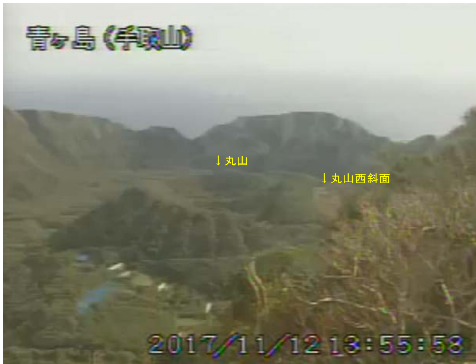
図 1 青ヶ島 丸山西斜面の状況 (11 月 12 日 手取山監視カメラによる)

1) GNSS (Global Navigation Satellite Systems) とは、GPS をはじめとする衛星測位システム全般を示す呼称です。