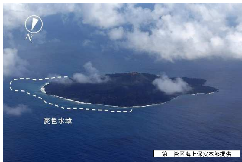
図3 西之島 変色水域（10月7日） ・西之島の沿岸に、薄い青白色または薄い黄緑色の変色水域が分布していました。