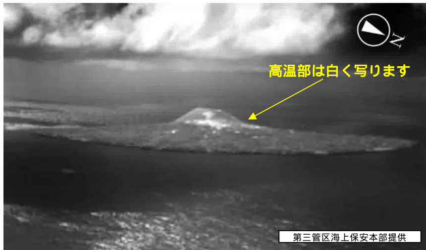
図2 西之島 島全体の熱画像（10月7日） ・溶岩流の先端や海岸線に、顕著な高温部は認められませんでした。