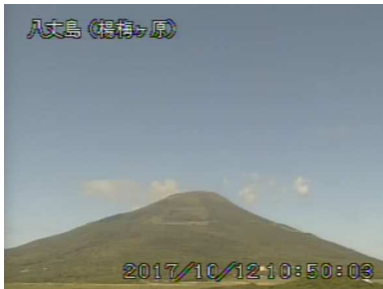
図 1 八丈島 西山山頂部の状況 (10月12日 楊梅ヶ原 ようめがはら 監視カメラによる)

1) GNSS (Global Navigation Satellite Systems) とは、GPS をはじめとする衛星測位システム全般を示す呼称です。