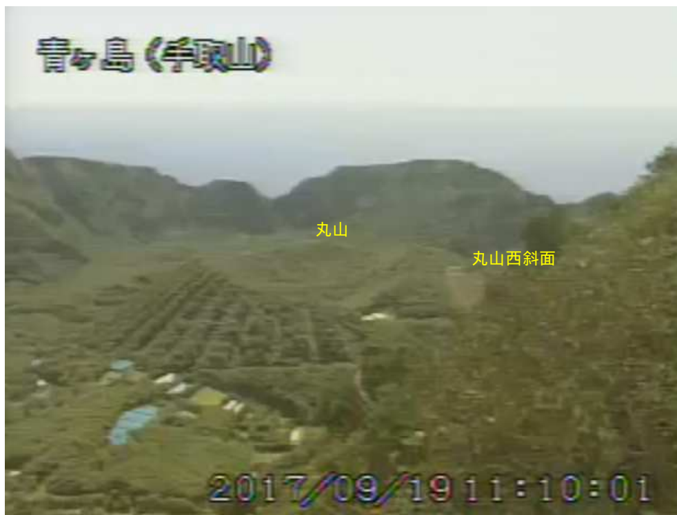
図 1 青ヶ島 丸山西斜面の状況 (9月19日 手取山監視カメラによる)

1) GNSS (Global Navigation Satellite Systems) とは、GPS をはじめとする衛星測位システム全般を示す呼称です。