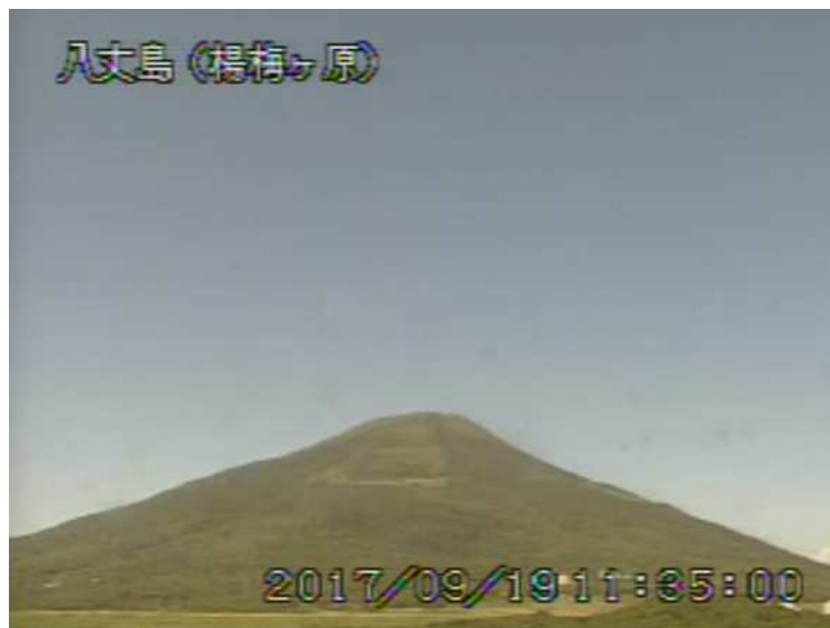
図 1 八丈島 西山山頂部の状況 (9月19日 楊梅ヶ原 ようめがはら 監視カメラによる)

1) GNSS (Global Navigation Satellite Systems) とは、GPS をはじめとする衛星測位システム全般を示す呼称です。