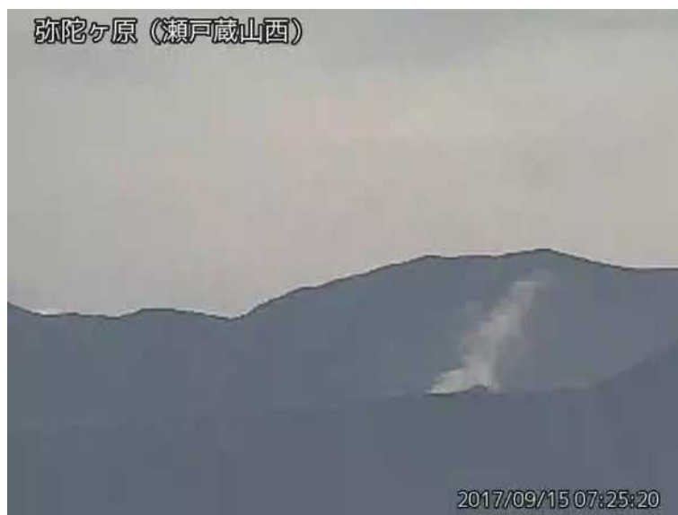
図 1 弥陀ヶ原 地獄谷からの噴気の状況 （9 月 15 日、瀬戸蔵山西監視カメラによる）

弥陀ヶ原近傍を震源とする火山性地震の発生回数は少なく、地震活動は低調に経過しています。火山性微動は観測されていません。