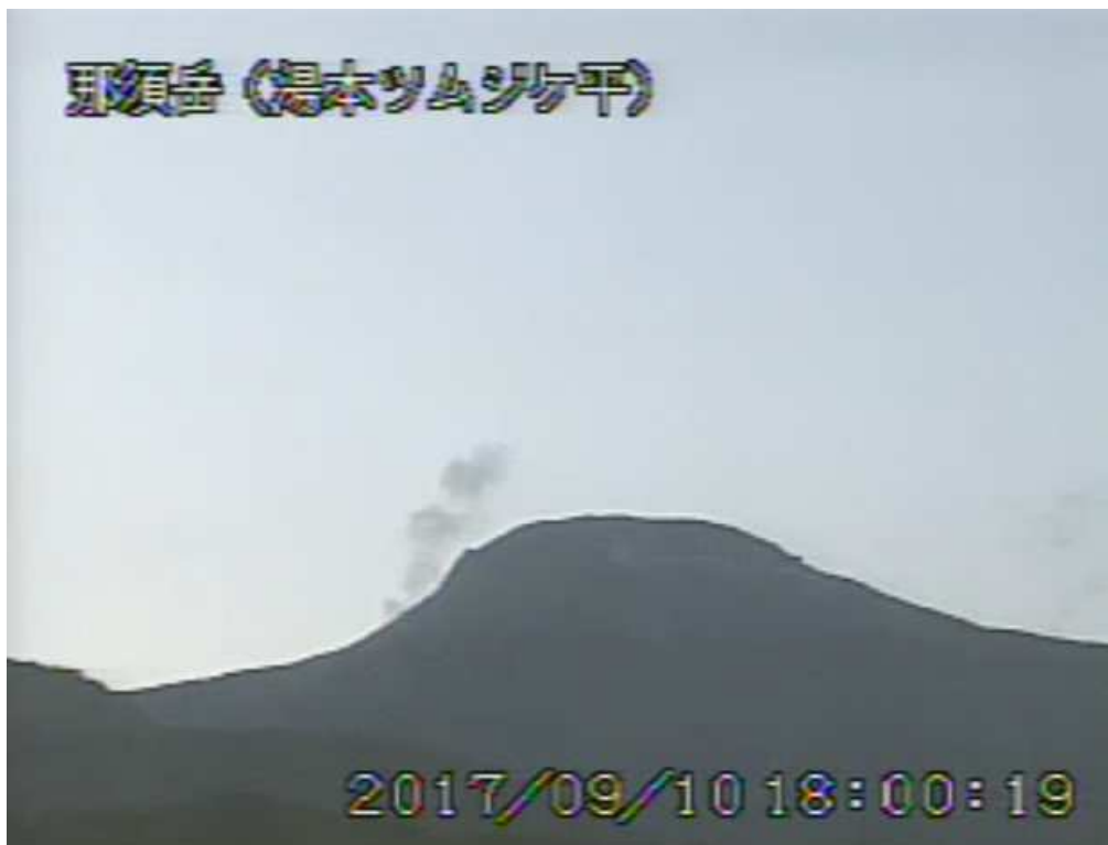
図 1 那須岳 茶臼岳の状況（9 月 10 日、湯本ツムジケ平監視カメラによる）

1) GNSS (Global Navigation Satellite Systems) とは、GPSをはじめとする衛星測位システム全般を示す呼称です。