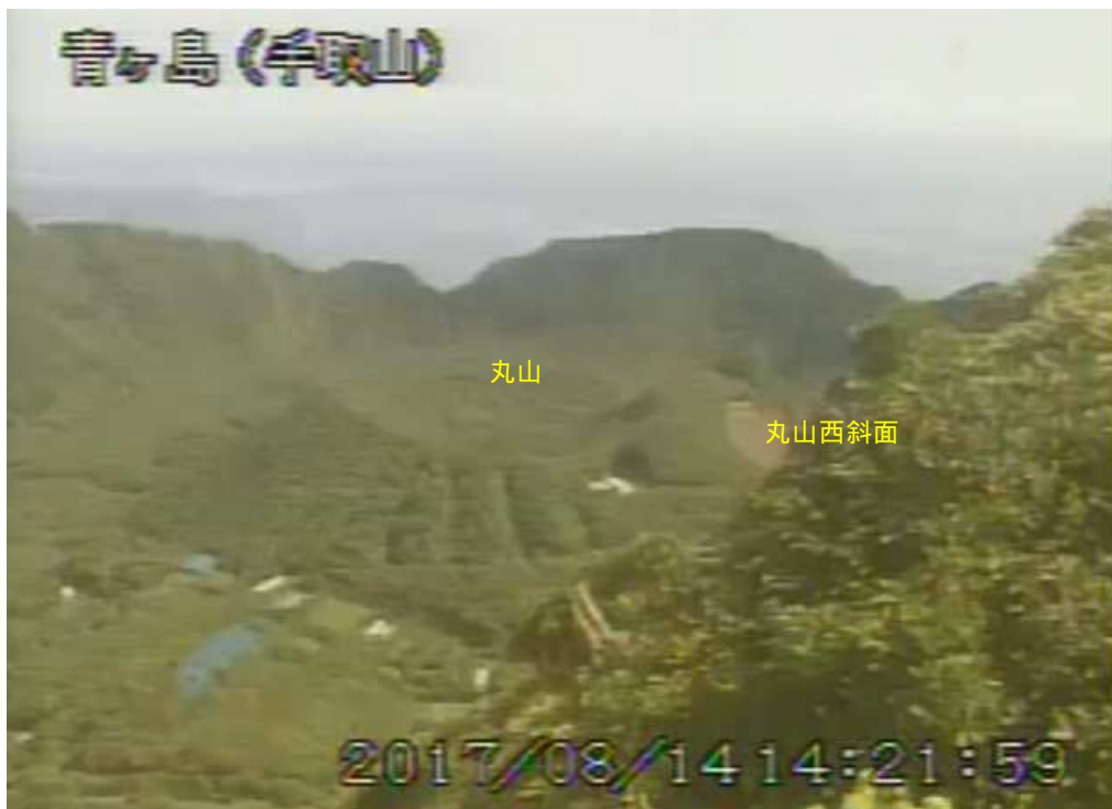
図 1 青ヶ島 丸山西斜面の状況 (8月14日 手取山監視カメラによる)

1) GNSS (Global Navigation Satellite Systems) とは、GPS をはじめとする衛星測位システム全般を示す呼称です。