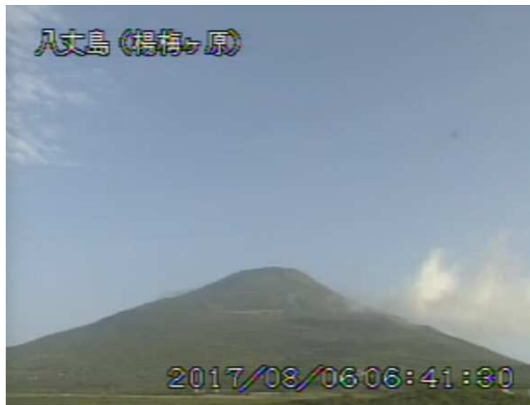
図 1 八丈島 西山山頂部の状況 (8月6日 楊梅ヶ原 ようめがはら 監視カメラによる)

1) GNSS (Global Navigation Satellite Systems) とは、GPS をはじめとする衛星測位システム全般を示す呼称です。