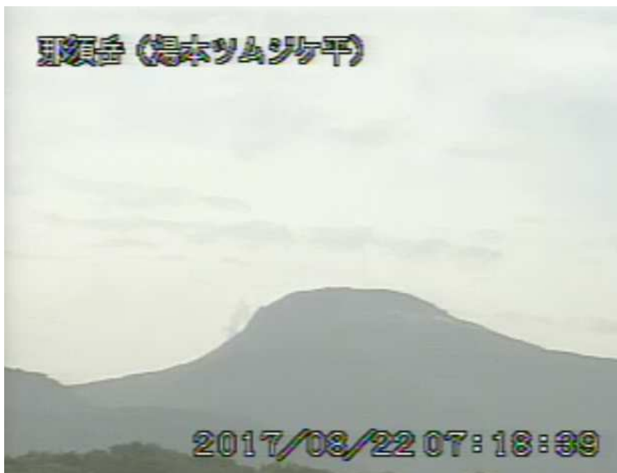
図 1 那須岳 茶臼岳の状況（8 月 22 日、湯本ツムジケ平監視カメラによる）

1) GNSS (Global Navigation Satellite Systems) とは、GPS をはじめとする衛星測位システム全般を示す呼称です。