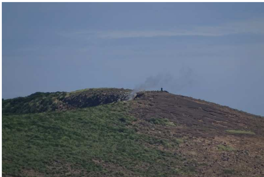
図3 硫黄鳥島 グスク火口の状況(4日)