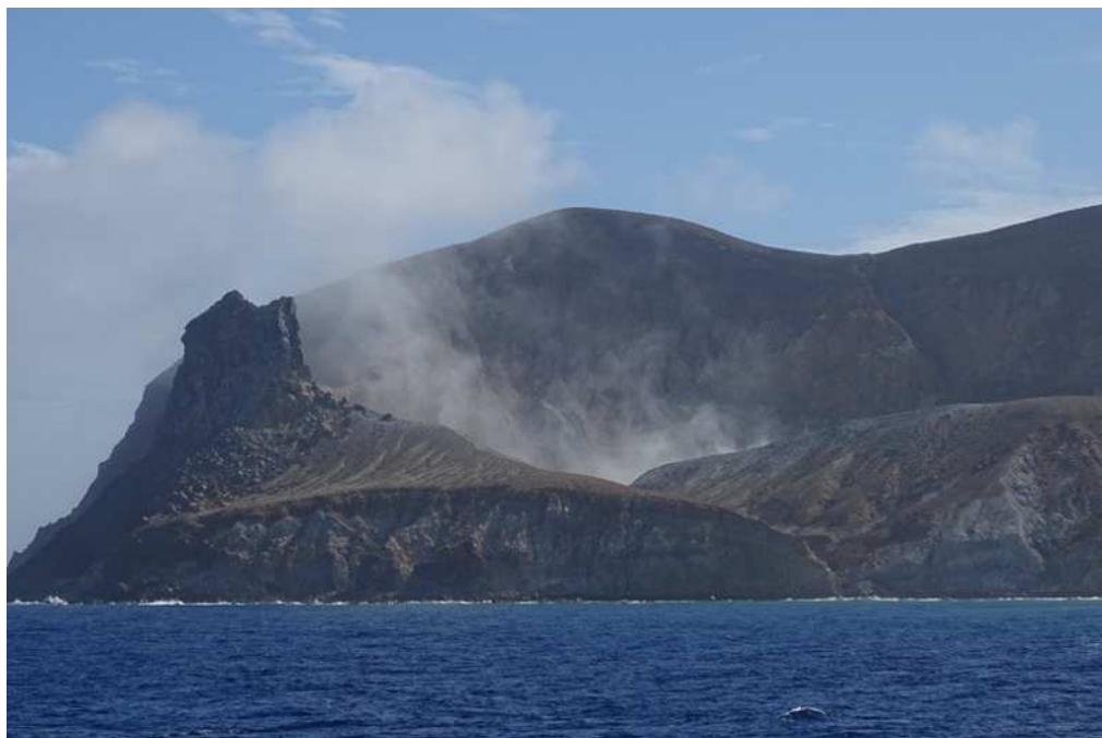
図2 硫黄鳥島 硫黄岳火口の状況(4日)