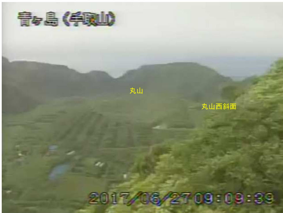
図 1 青ヶ島 丸山西斜面の状況 (6月27日 手取山監視カメラによる)

1) GNSS (Global Navigation Satellite Systems) とは、GPS をはじめとする衛星測位システム全般を示す呼称です。