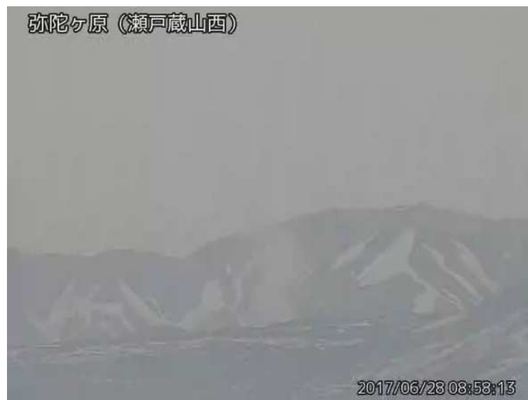
図 1 弥陀ヶ原 地獄谷からの噴気の状況 （6 月 28 日、瀬戸蔵山西監視カメラによる）

弥陀ヶ原近傍を震源とする火山性地震の発生回数は少なく、地震活動は低調に経過しています。火山性微動は観測されていません。