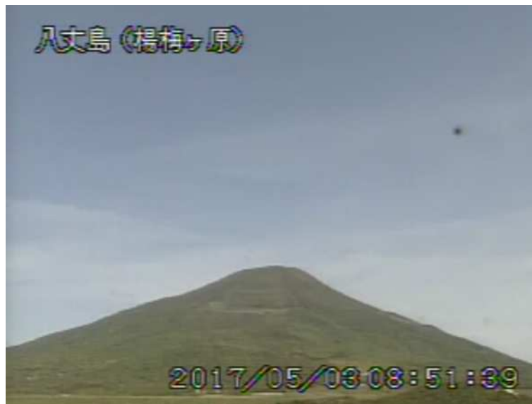
図 1 八丈島 西山山頂部の状況 (5月3日 楊梅ヶ原 ようめがはら 監視カメラによる)

1) GNSS (Global Navigation Satellite Systems) とは、GPS をはじめとする衛星測位システム全般を示す呼称です。