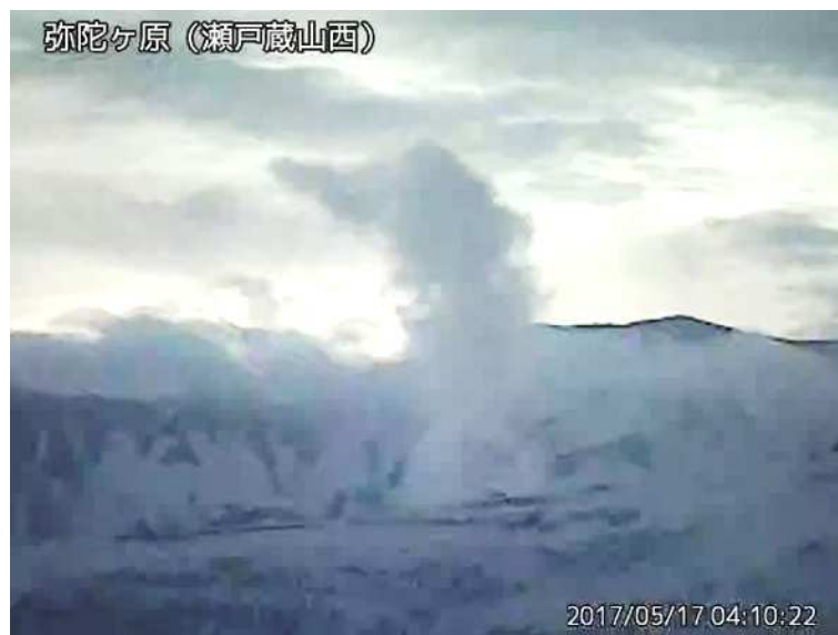
図 1 弥陀ヶ原 地獄谷からの噴気の状況 （5 月 17 日、瀬戸蔵山西監視カメラによる）

弥陀ヶ原近傍を震源とする火山性地震の発生回数は少なく、地震活動は低調に経過しています。火山性微動は観測されていません。