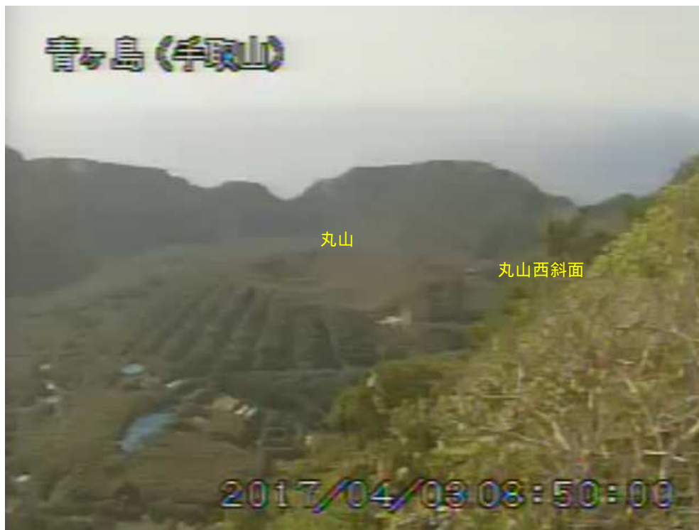
図 1 青ヶ島 丸山西斜面の状況 （4月3日 手取山監視カメラによる）

1) GNSS (Global Navigation Satellite Systems) とは、GPS をはじめとする衛星測位システム全般を示す呼称です。