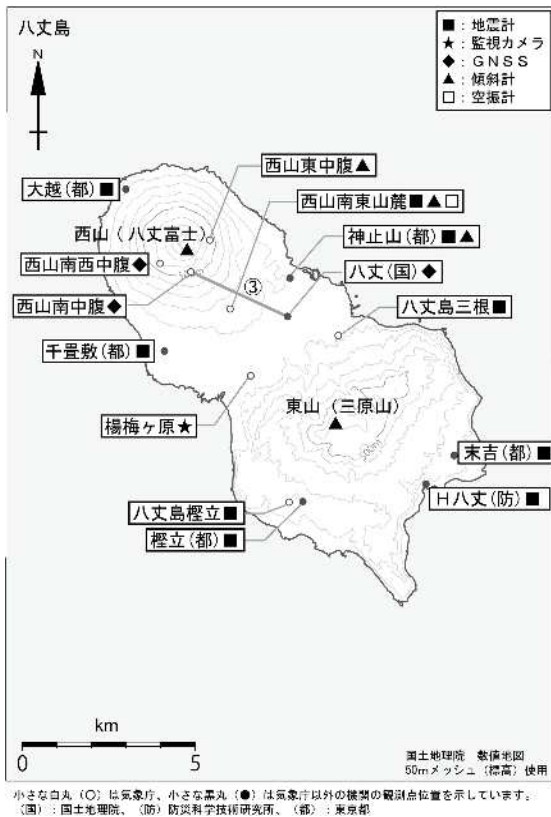
図4 八丈島 観測点配置図 GNS S 基線 は図2の に対応しています。