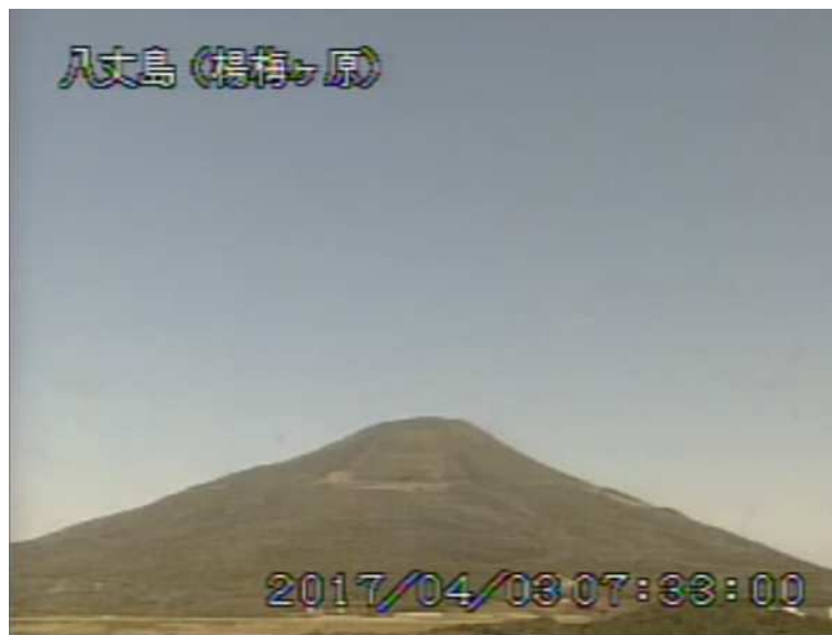
図 1 八丈島 西山山頂部の状況 (4月3日 楊梅ヶ原 ようめがはら 監視カメラによる)

1) GNSS (Global Navigation Satellite Systems) とは、GPS をはじめとする衛星測位システム全般を示す呼称です。