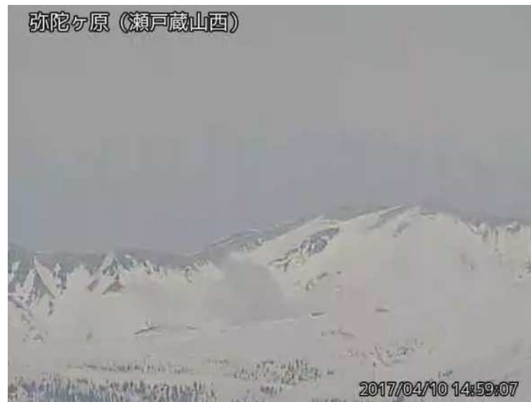
図 1 弥陀ヶ原 地獄谷からの噴気の状況 （4 月 10 日、瀬戸蔵山西監視カメラによる）

弥陀ヶ原近傍を震源とする火山性地震の発生回数は少なく、地震活動は低調に経過しています。火山性微動は観測されていません。