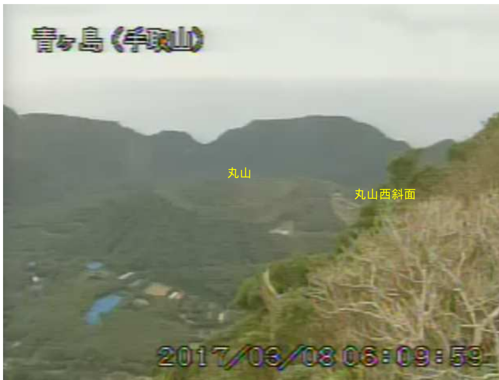
図 1 青ヶ島 丸山西斜面の状況 (3月8日 手取山監視カメラによる)

1) GNSS (Global Navigation Satellite Systems) とは、GPS をはじめとする衛星測位システム全般を示す呼称です。