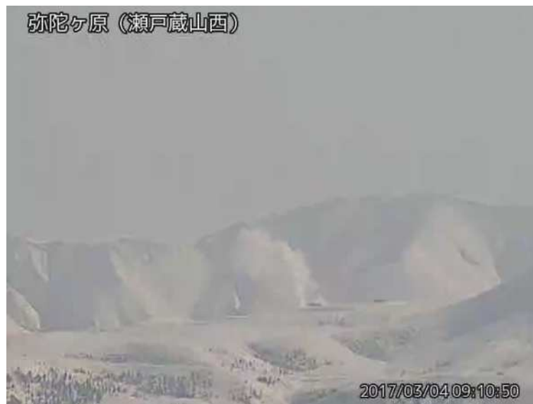
図 1 弥陀ヶ原 地獄谷からの噴気の状況 （3月4日、瀬戸蔵山西監視カメラによる）

弥陀ヶ原近傍を震源とする火山性地震の発生回数は少なく、地震活動は低調に経過しています。火山性微動は観測されていません。