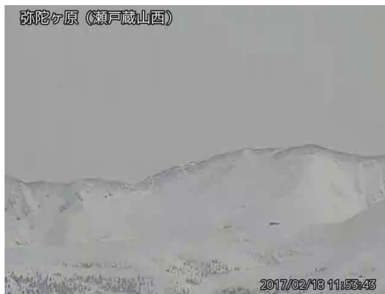
図 1 弥陀ヶ原 地獄谷からの噴気の状況 （2月18日、瀬戸蔵山西監視カメラによる）

弥陀ヶ原近傍を震源とする火山性地震の発生回数は少なく、地震活動は低調に経過しています。火山性微動は観測されていません。