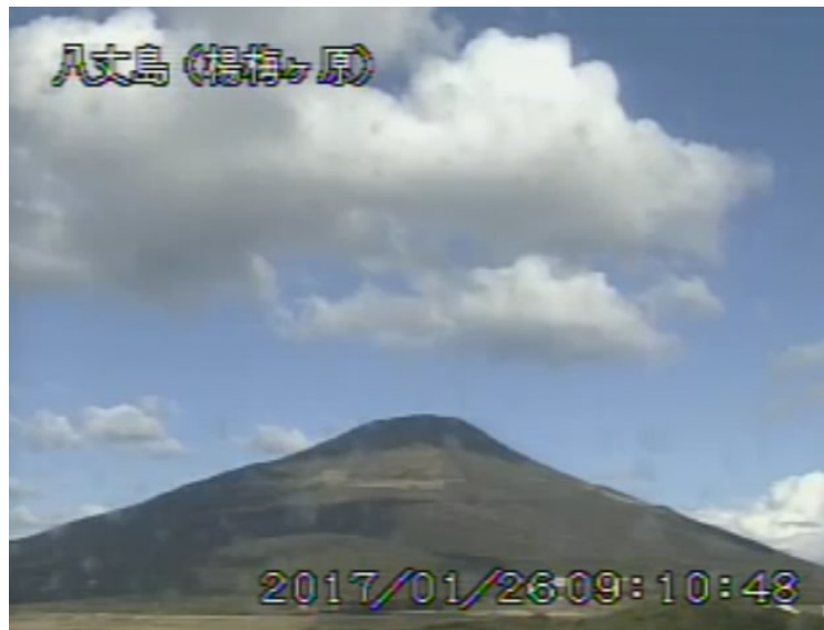
図 1 八丈島 西山山頂部の状況 (1月26日 楊梅ヶ原 ようめがはら 監視カメラによる)

1) GNSS (Global Navigation Satellite Systems) とは、GPS をはじめとする衛星測位システム全般を示す呼称です。