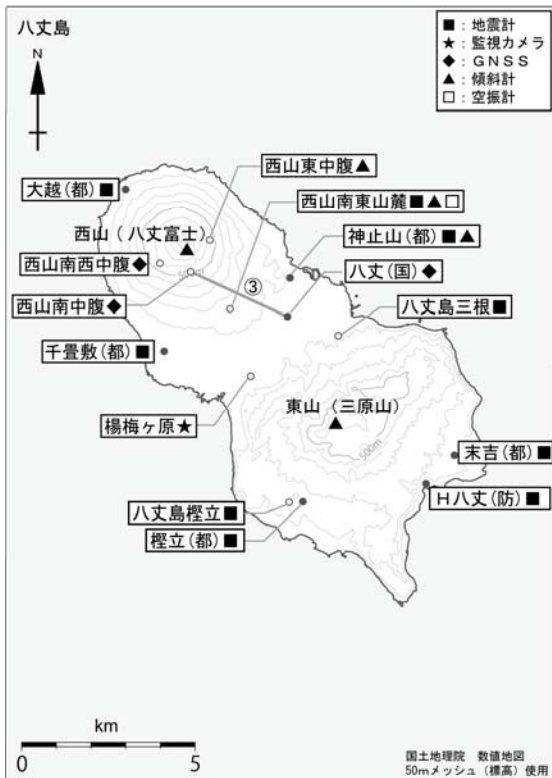
図 4 八丈島 観測点配置図 GNSS 基線③は図 2 の③に対応しています。