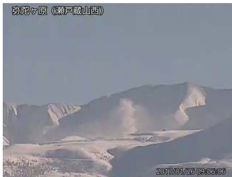
図 1 弥陀ヶ原 地獄谷からの噴気の状況 （1 月 26 日、瀬戸蔵山西監視カメラによる）

弥陀ヶ原近傍を震源とする火山性地震の発生回数は少なく、地震活動は低調に経過しています。火山性微動は観測されていません。