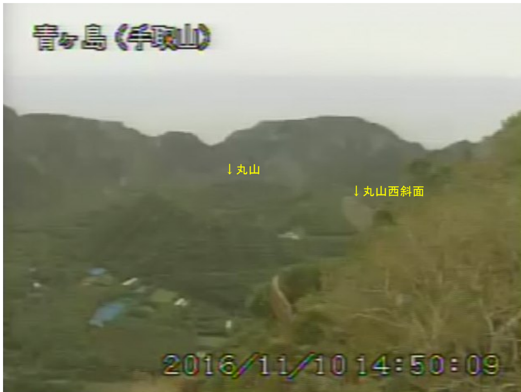
図 1 青ヶ島 丸山西斜面の状況 (11 月 10 日 手取山監視カメラによる)

1) GNSS (Global Navigation Satellite Systems) とは、GPS をはじめとする衛星測位システム全般を示す呼称です。