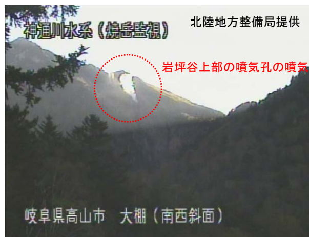
図 1 焼岳 山頂部及び南西斜面の状況

(左図：10 月 15 日 焼岳北カメラ、右図：10 月 15 日 焼岳南西斜面カメラ)