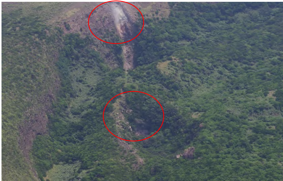
図 1 硫黄鳥島 グスク火口の噴気の状態（1日）（第十一管区海上保安本部提供） ・グスク火口内の2ヶ所（赤丸内）で弱い白色の噴気が認められました。

1日に第十一管区海上保安本部が実施した上空からの観測では、特段の変化は認められませんでした。 グスク火口周辺や硫黄岳火口内では白色噴気が認められました（図 1、2）。 硫黄鳥島の西側海岸線に沿って、青白色の変色水が分布していました（図 3）。