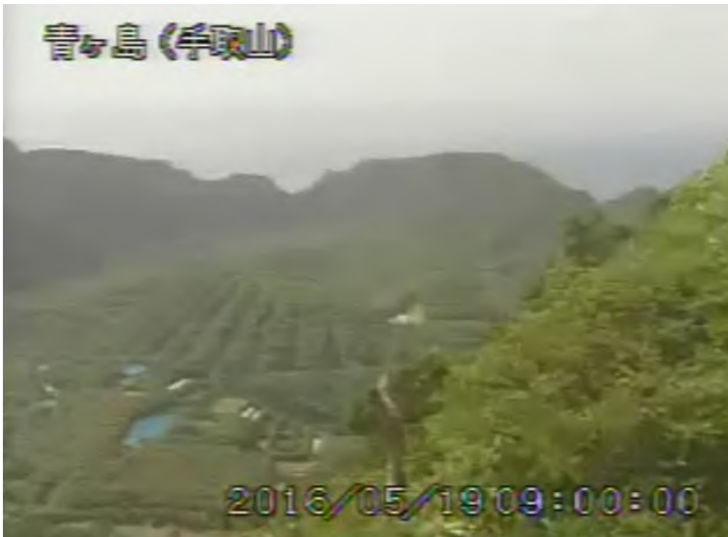
図 1 青ヶ島 丸山西斜面の状況 (5月19日 手取山遠望カメラによる)

1) GNSS (Global Navigation Satellite Systems) とは、GPS をはじめとする衛星測位システム全般を示す呼称です。