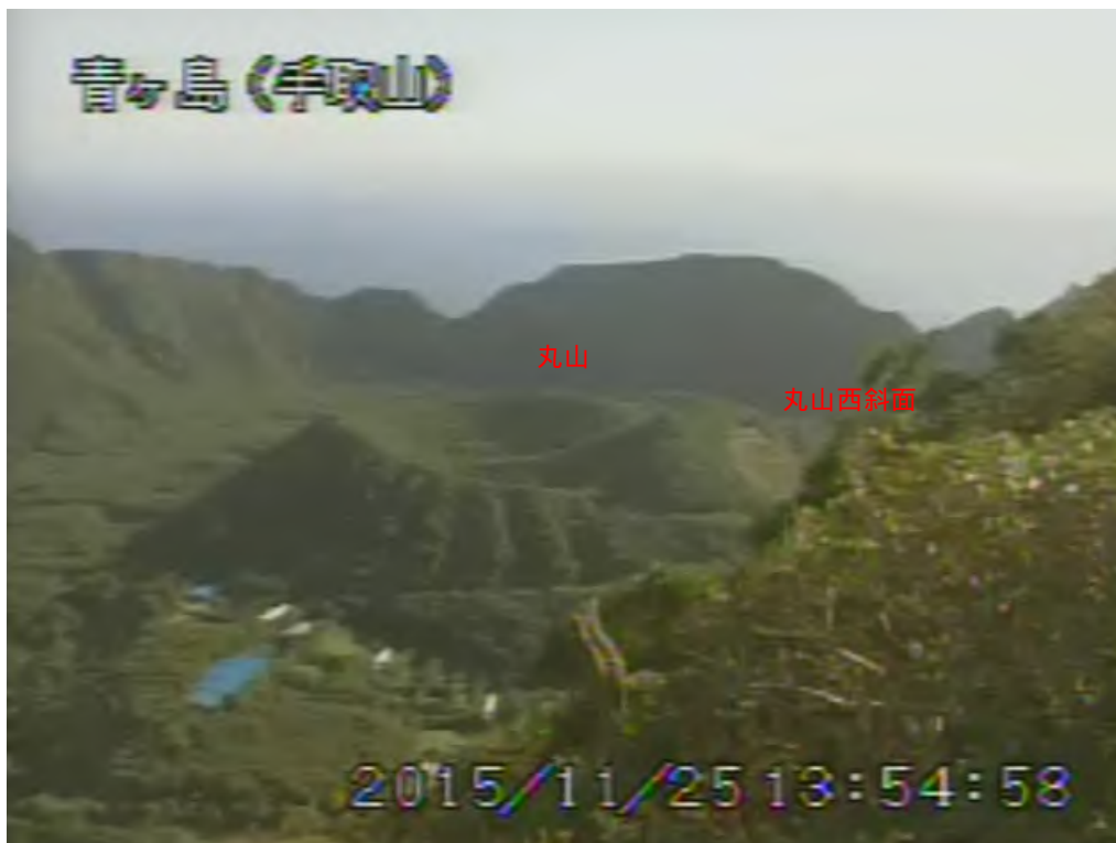
図 1 青ヶ島 丸山西斜面の状況 （11 月 25 日 手取山遠望カメラによる）

注）GNSS（Global Navigation Satellite Systems）とは、GPSをはじめとする衛星測位システム全般を示す呼称です。