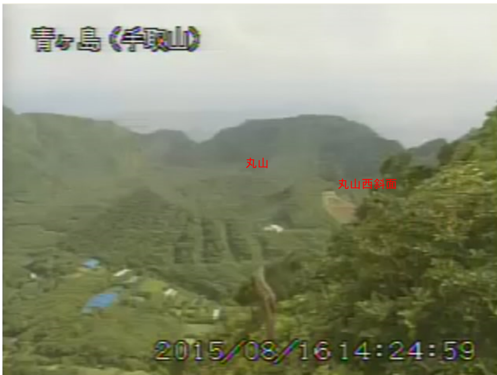
図 1 青ヶ島 丸山西斜面の状況 （8月16日 手取山遠望カメラによる）

注）GNSS（Global Navigation Satellite Systems）とは、GPSをはじめとする衛星測位システム全般を示す呼称です。