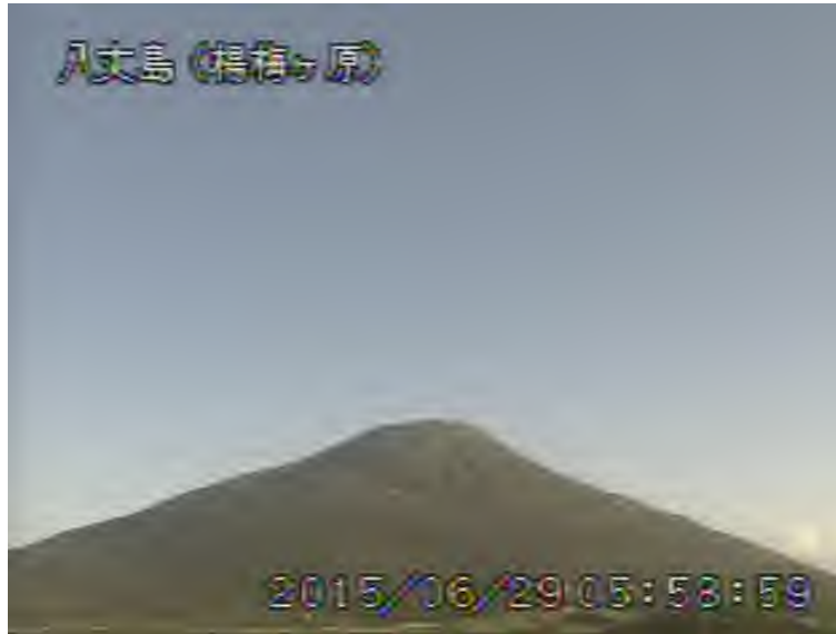
図 1 八丈島 西山山頂部の状況 （6月29日 楊梅ヶ原 ようめがはら 遠望カメラによる）

注）GNSS（Global Navigation Satellite Systems）とは、GPSをはじめとする衛星測位システム全般を示す呼称です。