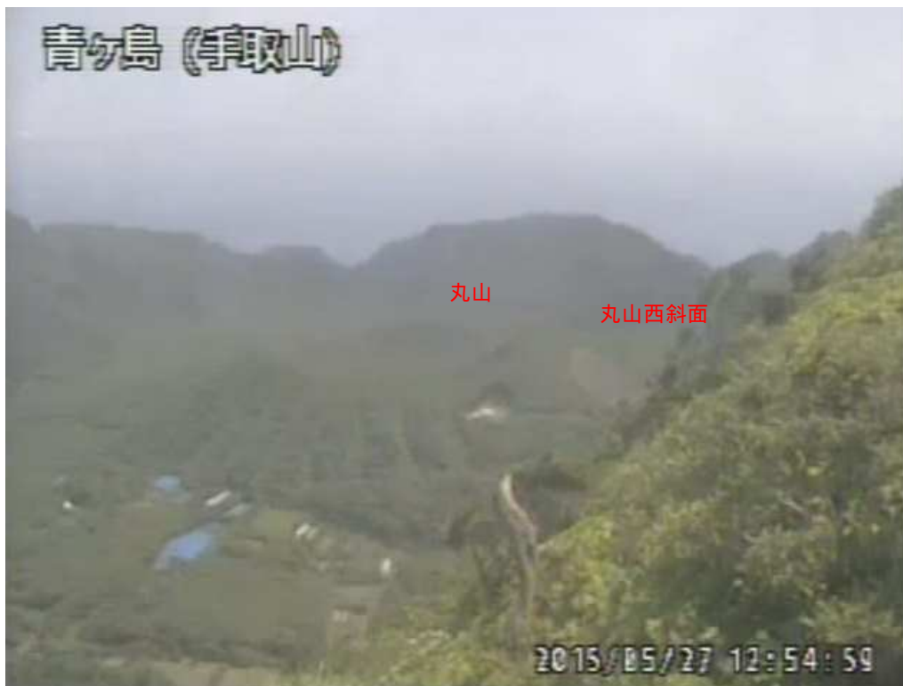
図 1 青ヶ島 丸山西斜面の状況 （5 月 27 日 手取山遠望カメラによる）

注）GNSS（Global Navigation Satellite Systems）とは、GPSをはじめとする衛星測位システム全般を示す呼称です。