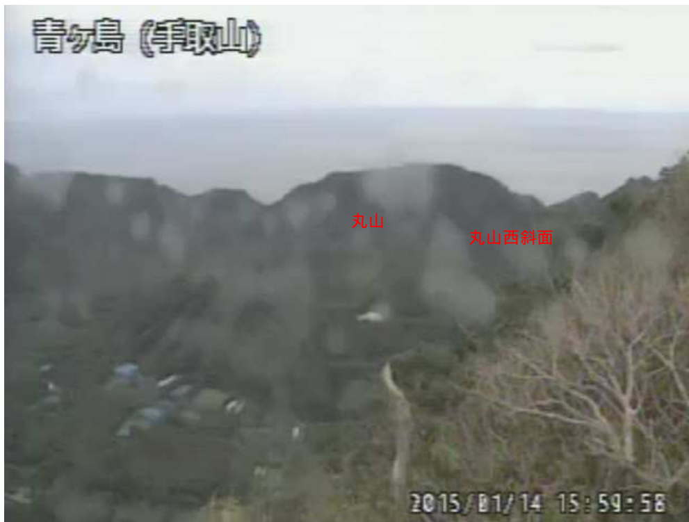
図1 青ヶ島 丸山西斜面の状況 (1月14日 手取山遠望カメラによる)

注) GNSS(Global Navigation Satellite Systems)とは、GPSをはじめとする衛星測位システム全般を示す呼称です。