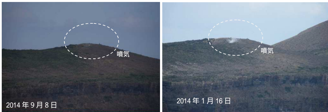
図3 硫黄島 グスク火山火口の状況(火口東側から撮影)