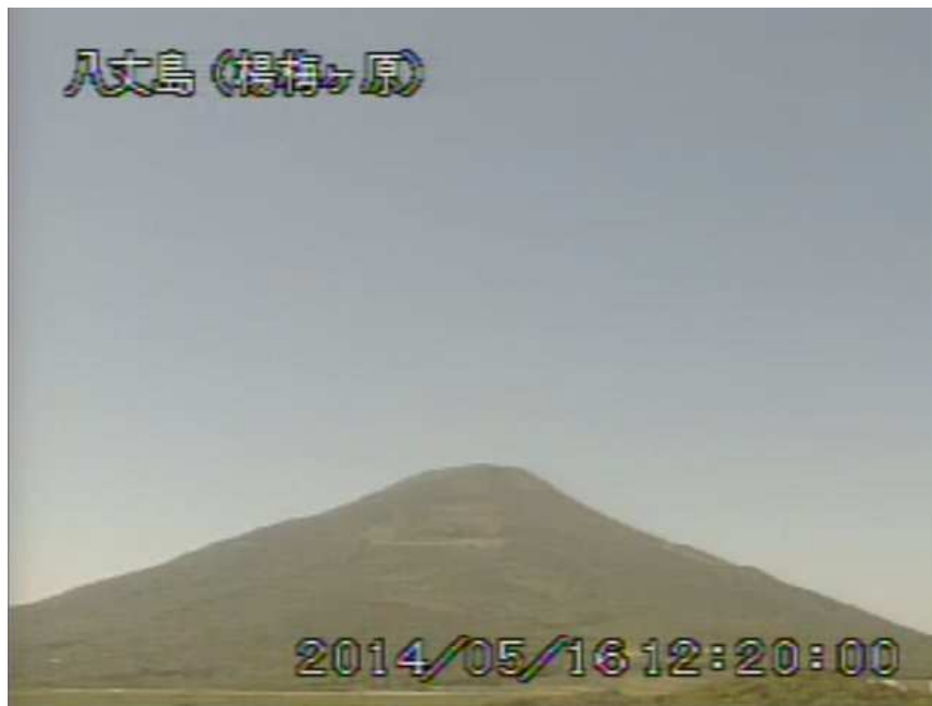
図 1 八丈島 西山山頂部の状況 （5月16日 楊梅ヶ原遠望カメラによる）

注）GNSS（Global Navigation Satellite Systems）とは、GPSをはじめとする衛星測位システム全般を示す呼称です。