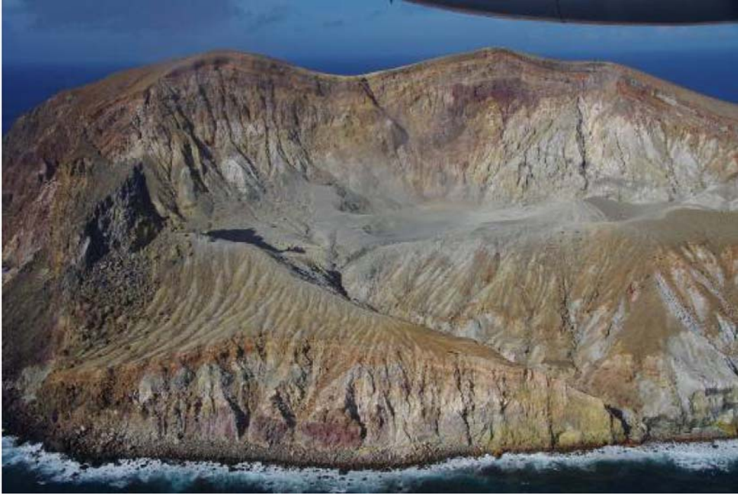
図4 硫黄島 硫黄岳火口の状況