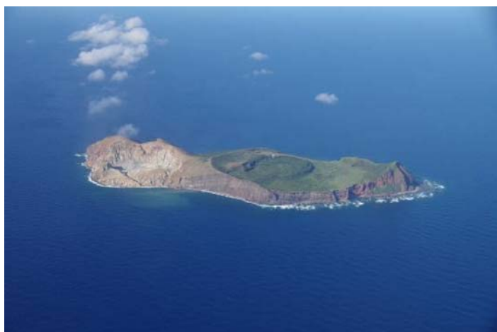
図2 硫黄鳥島 全景(南西側から撮影)