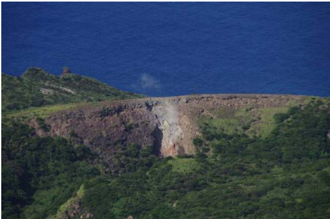
図5 硫黄島 グスク火山火口からの噴気の状況