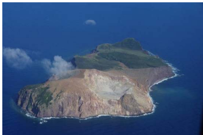
図3 硫黄鳥島 全景(北西側から撮影)

この火山活動解説資料は気象庁ホームページ ( http://www.seisvol.kishou.go.jp/tokyo/volcano.html ) でも閲覧することができます。