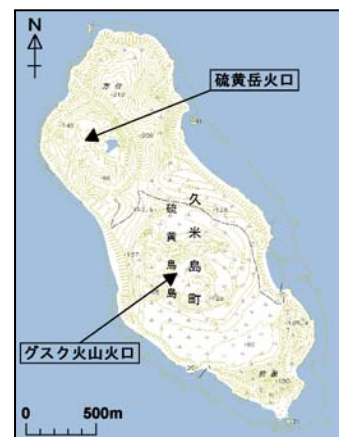
図1 硫黄鳥島 火口位置図

7 日に気象庁地球環境・海洋部及び長崎海洋気象台が実施した海上からの観測では、島の北側に位置する硫黄岳火口及び中央部に位置するグスク火山火口から、従来より認められている少量の噴気が確認され、前回の観測時（2012 年 1 月 11 日）と比べてその状況に特段の変化は認められませんでした。