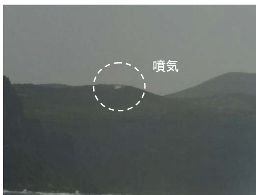
図3 硫黄鳥島 グスク火山火口(左:2012年5月7日 島東側から撮影 右:2012年1月11日 島南側から撮影)

この火山活動解説資料は気象庁ホームページ ( http://www.seisvol.kishou.go.jp/tokyo/volcano.html ) でも閲覧することができます。