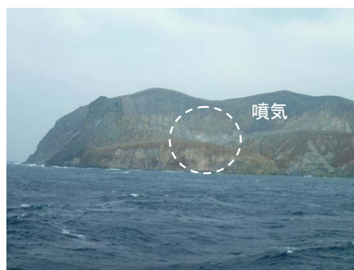
図2 硫黄岳火口(左:2012年5月7日 右:2012年1月11日 島南西側から撮影)