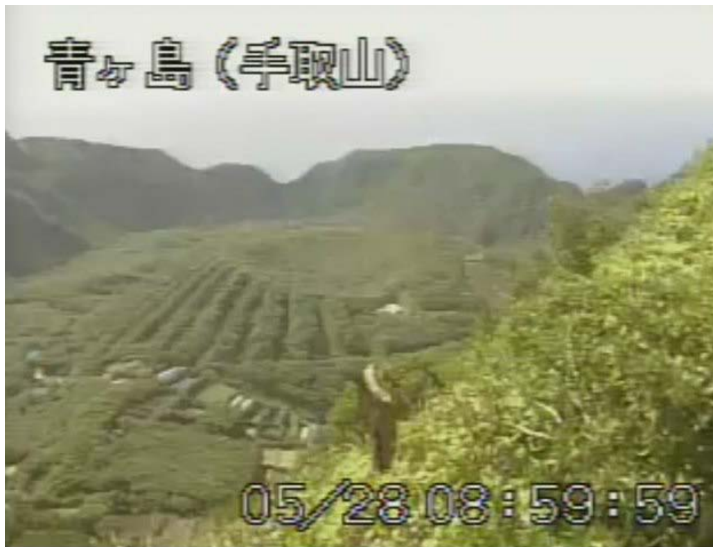
図 1 青ヶ島 丸山西斜面の状況 （5 月 28 日 手取山遠望カメラによる）

この火山活動解説資料は気象庁ホームページ ( http://www.seisvol.kishou.go.jp/tokyo/volcano.html ) でも閲覧することができます。次回の火山活動解説資料（平成 24 年 6 月分）は平成 24 年 7 月 9 日に発表する予定です。