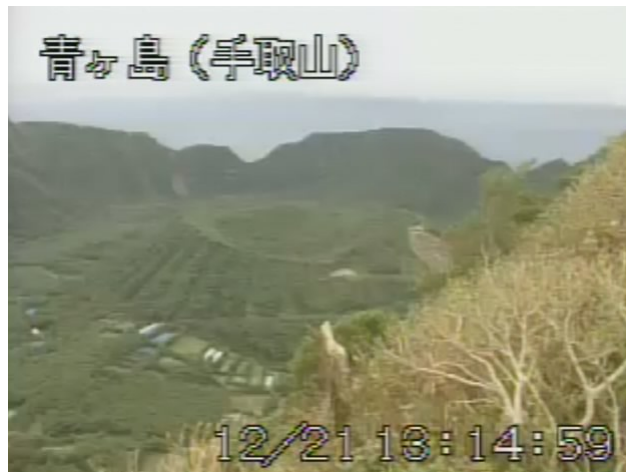
図 2 青ヶ島 丸山西斜面の状況 （12 月 21 日 手取山遠望カメラによる）