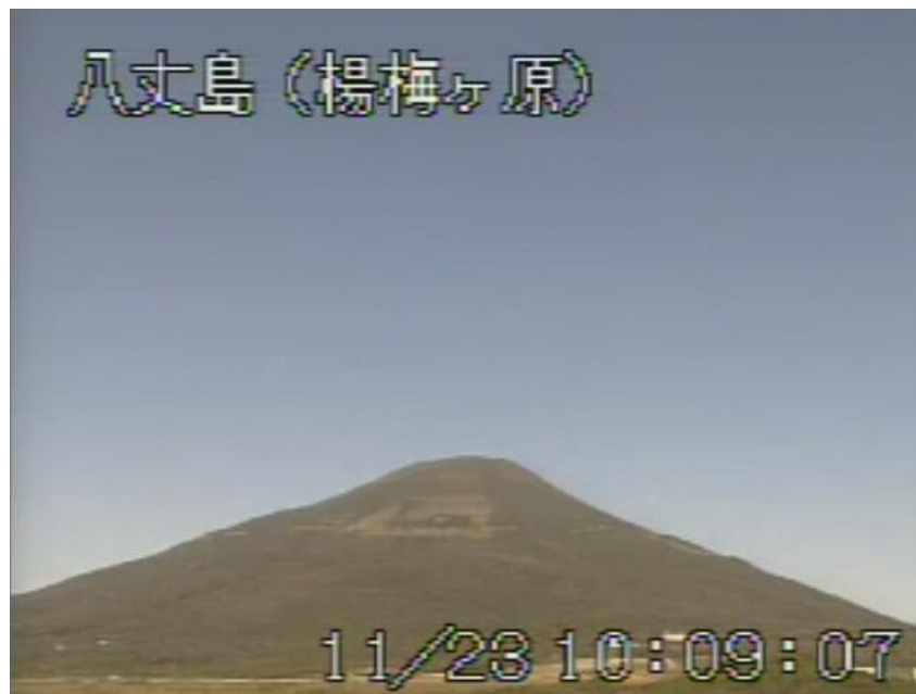
図 1 八丈島 山頂部の状況 (11 月 23 日 楊梅ヶ原遠望カメラによる)

八丈島付近を震源とする火山性地震の発生回数は少なく、地震活動は静穏に経過しました。 火山性微動は観測されませんでした。