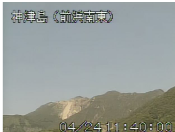
図 2 神津島 天上山山頂部の状況 （4 月 24 日、前浜南東遠望カメラによる）

この火山活動解説資料は気象庁ホームページ ( http://www.seisvol.kishou.go.jp/tokyo/volcano.html ) でも閲覧することができます。次回の火山活動解説資料（平成 23 年 5 月分）は平成 23 年 6 月 8 日に発表する予定です。