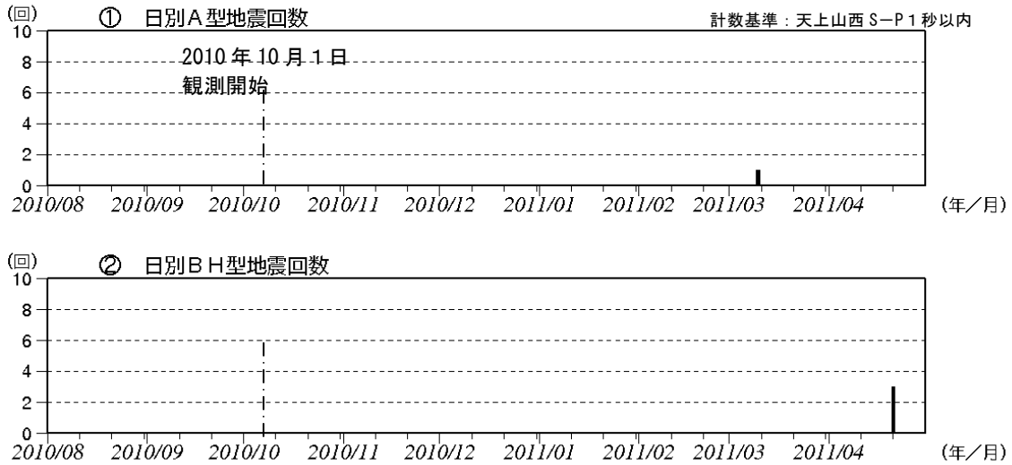
図3 神津島 日別地震回数(2010年8月～2011年4月) 3月分、4月分は一部未処理の期間があります。