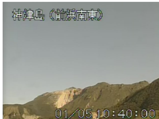
図 2 神津島 天上山山頂部の状況 （1 月 5 日、前浜南東遠望カメラによる）

この火山活動解説資料は気象庁ホームページ ( http://www.seisvol.kishou.go.jp/tokyo/volcano.html ) でも閲覧することができます。次回の火山活動解説資料（平成 23 年 2 月分）は平成 23 年 3 月 8 日に発表する予定です。