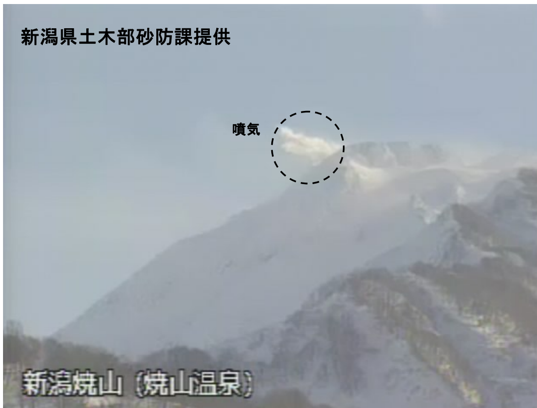
図 1※ 新潟焼山 山頂部の状況（1 月 8 日、山頂の北北西約 8 km にある焼山温泉監視カメラによる）

この火山活動解説資料は気象庁ホームページ ( http://www.seisvol.kishou.go.jp/tokyo/volcano.html ) でも閲覧することができます。次回の火山活動解説資料（平成 23 年 2 月分）は平成 23 年 3 月 8 日に発表する予定です。