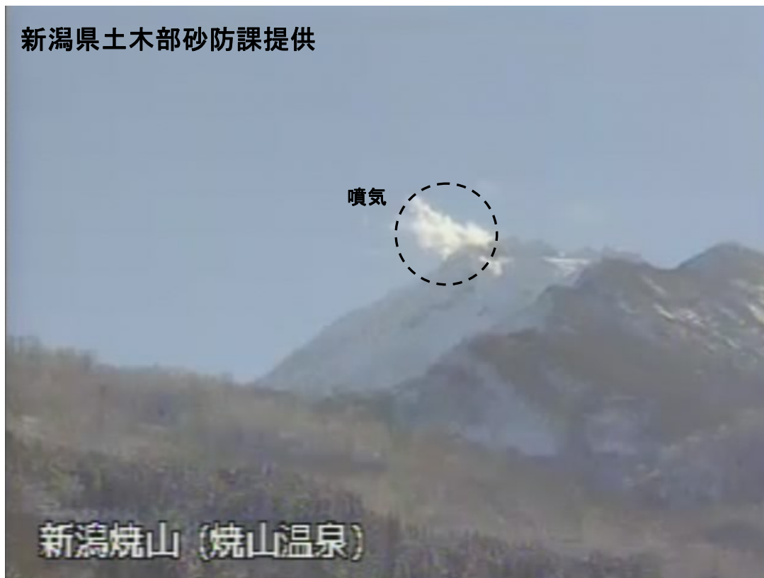
図 1※ 新潟焼山 山頂部の状況（12 月 17 日、山頂の北北西約 8 km にある焼山温泉監視カメラによる）

この火山活動解説資料は気象庁ホームページ ( http://www.seisvol.kishou.go.jp/tokyo/volcano.html ) でも閲覧することができます。次回の火山活動解説資料（平成 23 年 1 月分）は平成 23 年 2 月 8 日に発表する予定です。