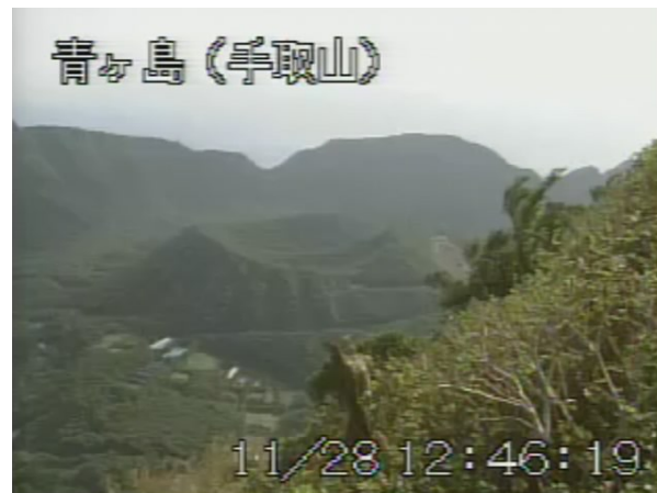
図 2 青ヶ島 丸山西斜面の状況 (11 月 28 日、手取山遠望カメラによる)