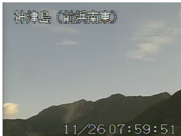
図 2 神津島 天上山山頂部の状況 （11 月 26 日、前浜南東遠望カメラによる）

この火山活動解説資料は気象庁ホームページ（ http://www.seisvol.kishou.go.jp/tokyo/volcano.html ）でも閲覧することができます。次回の火山活動解説資料（平成 22 年 12 月分）は平成 23 年 1 月 7 日に発表する予定です。